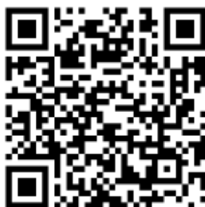
扫描二维码，下载客户端